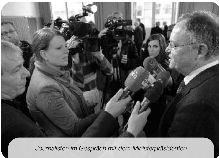
Journalisten im Gespräch mit dem Ministerpräsidenten