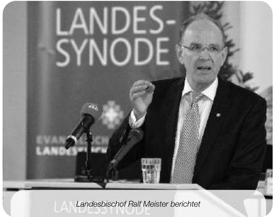
Landesbischof Ralf Meister berichtet

Meister mahnte, auch das Gedenken an die Toten werde immer mehr aus der Öffentlichkeit verdrängt. Er kritisierte das neue Bestattungsgesetz im Land Bremen. Dort darf ab Anfang