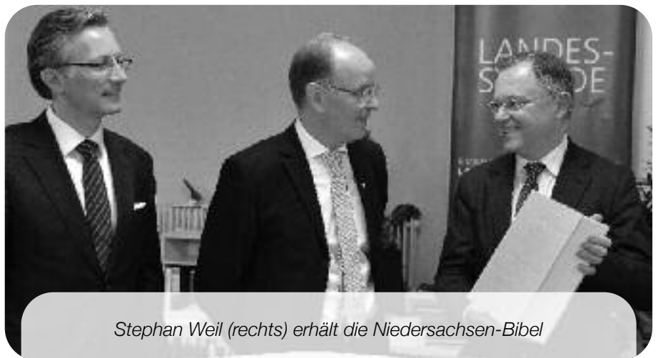
Stephan Weil (rechts) erhält die Niedersachsen-Bibel

Weil hob hervor, dass die Präambel der niedersächsischen Landesverfassung mit den Worten „Im Bewusstsein vor Gott und den Menschen“ beginne: „Das ist ein gutes Zeichen, wir sollten daran festhalten.“ Die Landessynode hatte den Ministerpräsidenten anlässlich des Themenjahrs „Reformation und Politik“ zu sich eingeladen. Weil machte durch humorvolle Bemerkungen über das parlamentarische Leben von Anfang an deutlich, dass er sich hier „zu Gast bei Freunden“ fühle. In seiner Rede betonte er, dass das Land am Religionsunterricht an den Schulen festhalten wolle: „Wir planen keine nennenswerten Änderungen.“